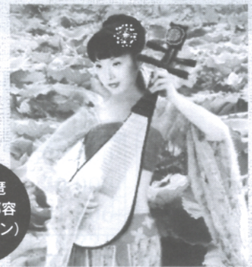
中国琵琶 演奏家 邵容 (シャオ・ロン)